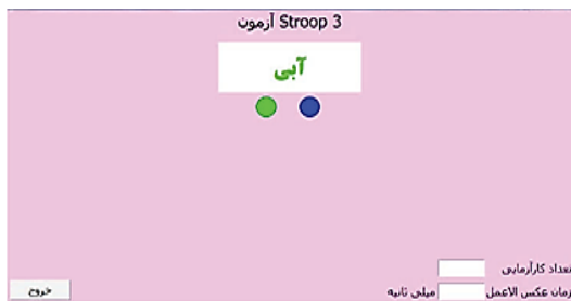
شکل ۲- آزمون استروپ ۳